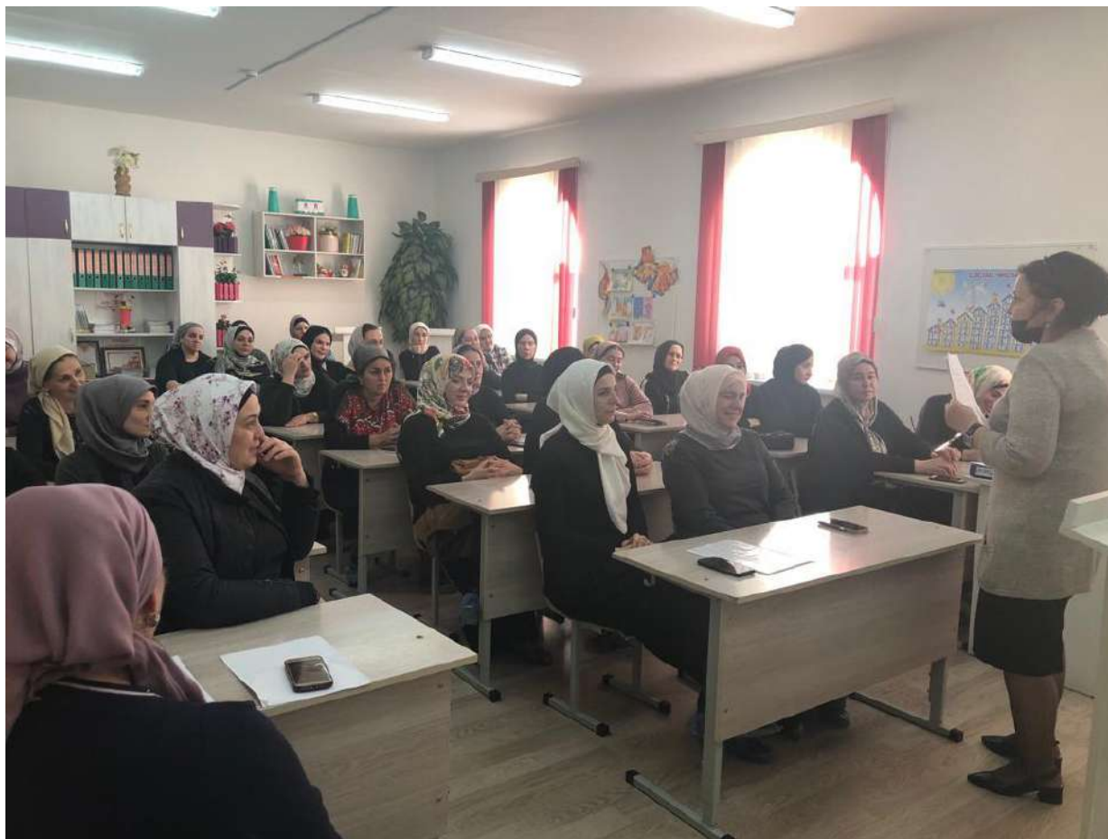
16 ноября прошло Собрание Совета родителей и всех председателей Родительского комитета 1-11-х классов, на котором обсуждались вопросы итогов первой четверти. Также рассматривался вопрос прививок от полиомиелита.