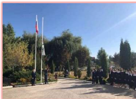
рассказала учащимся гражданской