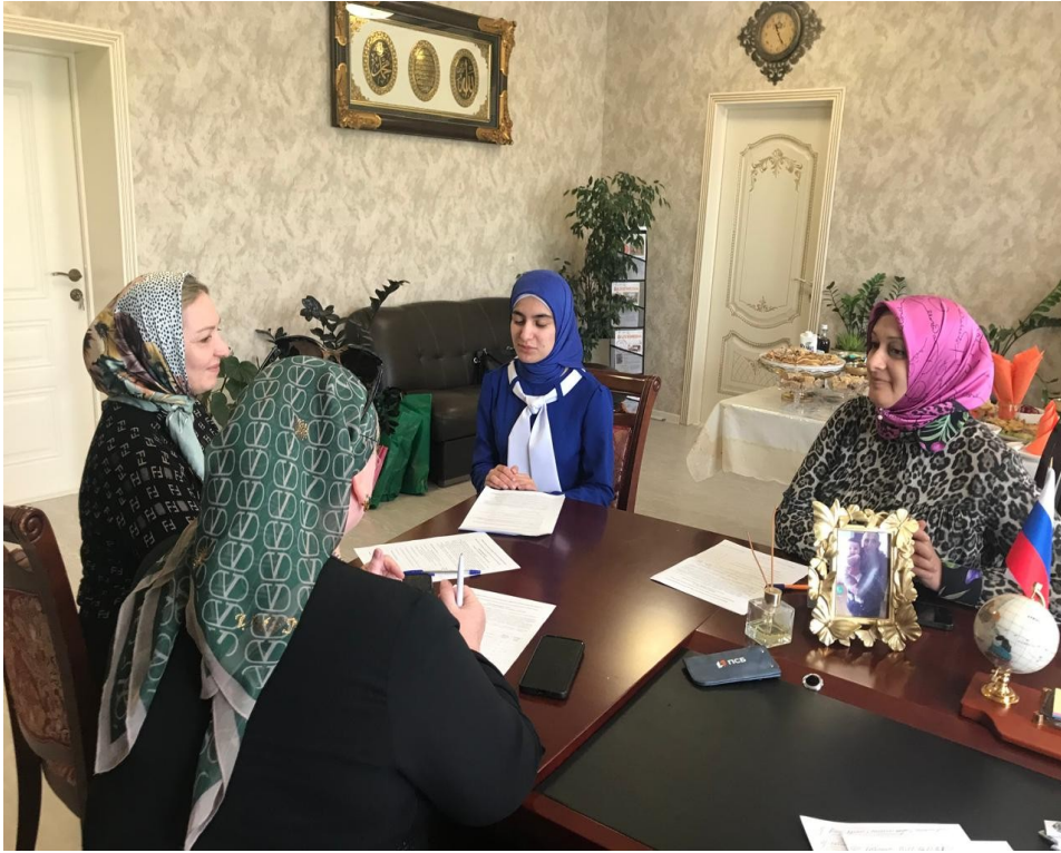
После проведенного урока идет его обсуждение.